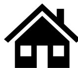
Landlordiaid Cymdeithasol Cofrestredig