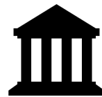
Llywodraeth Cymru a'i chyrff nodedig

Gellir canfod rhagor o wybodaeth am ein proses ar gyfer ymdrin â chwynion am gyrff cyhoeddus yng Nghymru ar ein gwefan (hefyd mewn fersiwn Hawdd ei Ddarllen ).