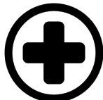
Y GIG (gan gynnwys meddygon teulu a deintyddion)