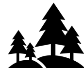
Awdurdodau Parciau Cenedlaethol

Gellir canfod rhagor o wybodaeth am ein proses ar gyfer ymdrin â chwynion am ymddygiad aelod o awdurdod lleol ar ein gwefan (hefyd mewn fersiwn Hawdd ei Ddarllen ).